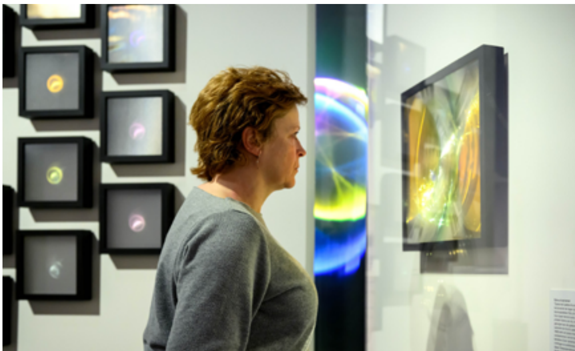
Zaalimpressie Stedelijk Museum Breda – kunstinstallatie Prismatic Reverberation.

De oprichters blijven de uitvoerende kunstenaars en zijn verantwoordelijk voor de artistieke kwaliteit, het ondernemerschap en de borging daarvan.