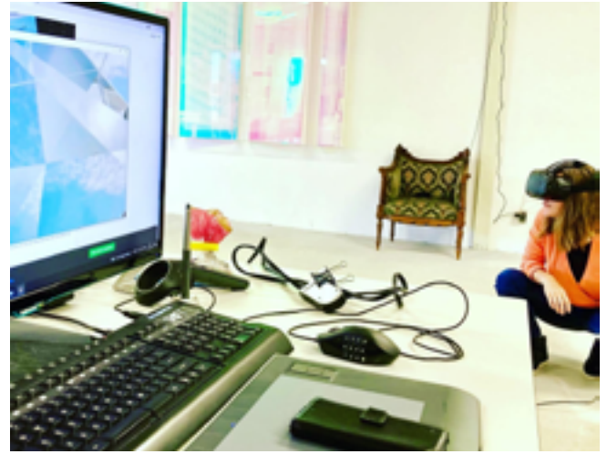
Experiment digitale koolstof atoom en VR