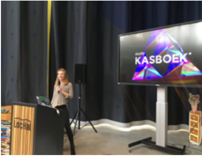
Presentatie bij Kunstloc Connects | Digitale Transformatie